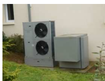
POMPE A CHALEUR